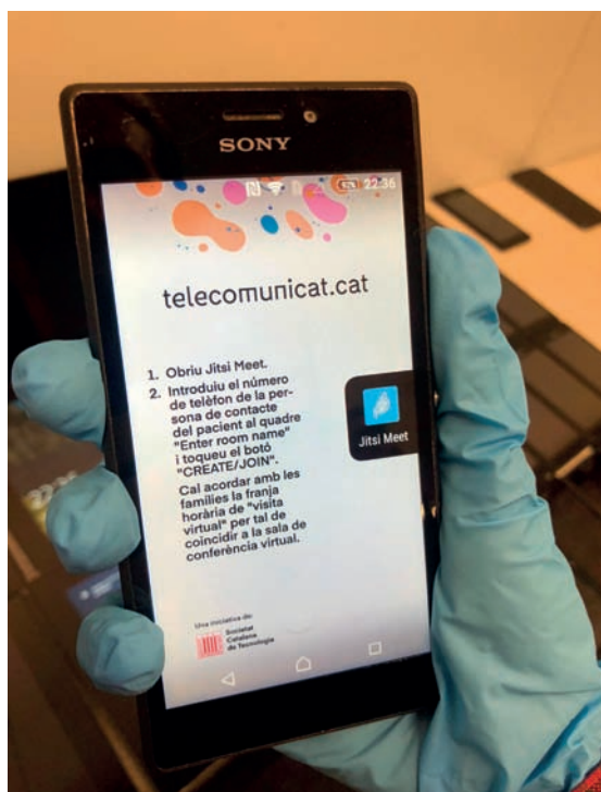
FIGURA 1. Pantalla principal de l'aplicació.

Així, mitjançant el projecte TelecomunicAT, oferim dispositius mòbils que, gràcies a les tecnologies de videotrucada, proporcionen «hores de visites virtuals», que connecten persones malaltes amb familiars i coneguts, amb la qual cosa es redueix el sentiment de soledat i s'ajuda, anímicament, algú que està en un llit d'hospital. Aquests dispositius mòbils són donats per la societat i per entitats, i són «adaptats» per instal·lar-hi un programa de videotrucada senzill i intuïtiu per tal que no hi hagi cap complicació a l'hora de fer-los servir. Davant la realitat d'alguns malalts de no poder sostenir els telèfons amb les mans, per feblesa o tremolors, una part de l'equip de TelecomunicAT ha dissenyat uns braços articulats, a partir de flexos convencionals, per donar suport i garantir aquesta «hora de visita virtual». Els hospitals que s'hi han volgut acollir han demanat el nombre de dispositius necessaris, els quals, en tot moment, han estat cedits gra-