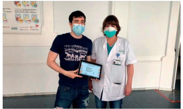
FIGURA 3. Un dels lliuraments de dispositius.

Tot plegat ha estat una idea senzilla, que s'ha desenvolupat gràcies a la col·laboració, la generositat i l'altruisme de persones i d'entitats, la suma d'esforços i talents de les quals han contribuït a aportar humanitat i «escalf humà» en aquests moments tan difícils de descriure. Gràcies a la tecnologia, situacions que semblaven impossibles han estat una realitat. I ens en congratulem!